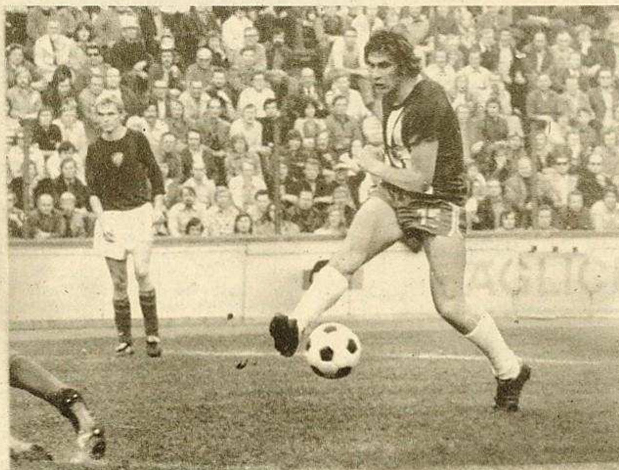
Chance für den 1. FCM durch Mewes, der den Ball jedoch knapp verzieht. Mit diesem Angriffsschwung imponierte der Gastgeber beim 2 : 1 über den BFC Dynamo wiederholt.