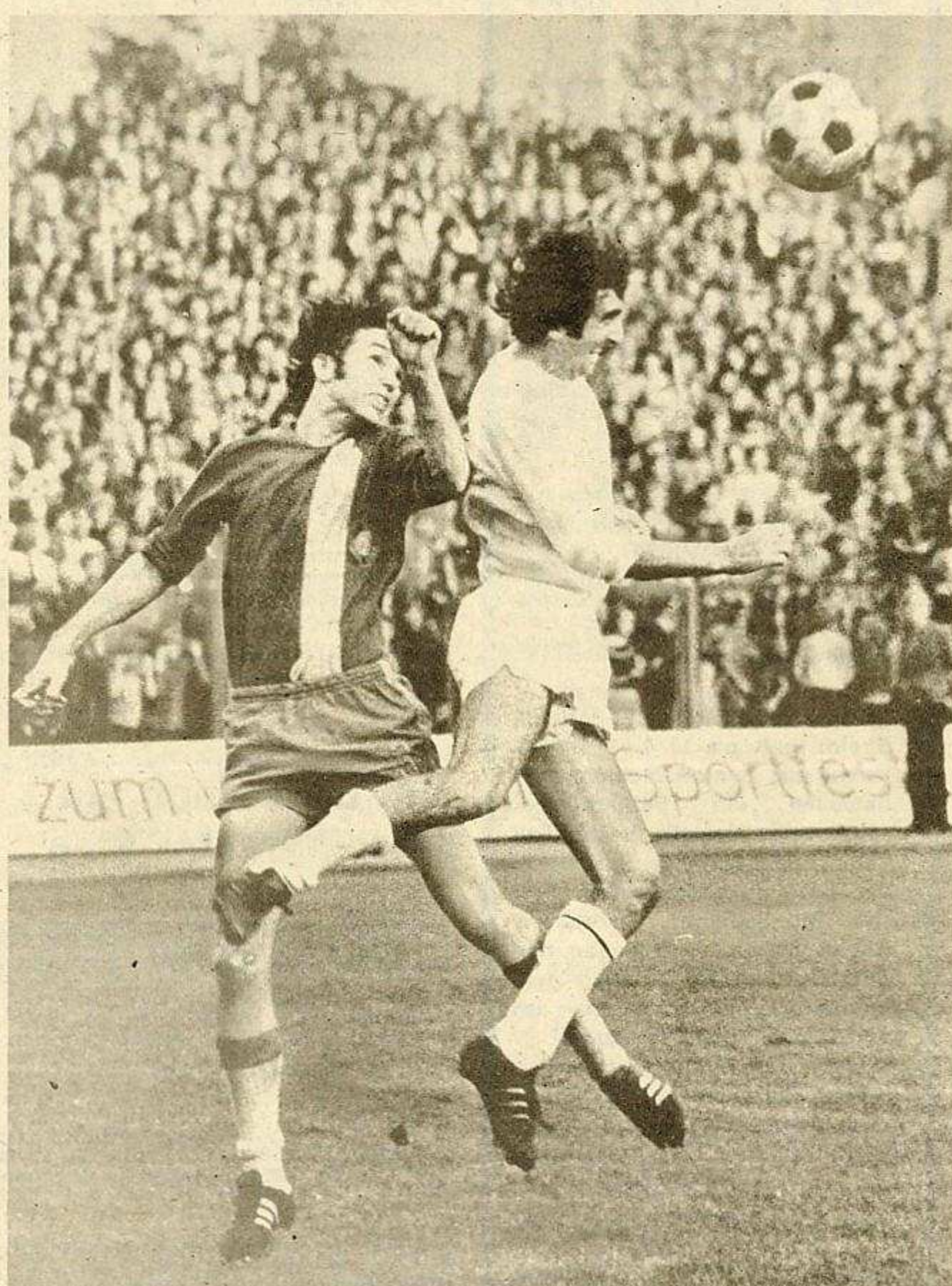
Nun brachte auch der 1. FCL beim 1 : 0 über den FC Vorwärts den ersten Sieg der Saison unter Dach und Fach! Hammer, Leipzigs Libero, unterbindet diese Aktion des Frankfurters Andrich (rechts) mit energischer Kopfballabwehr.